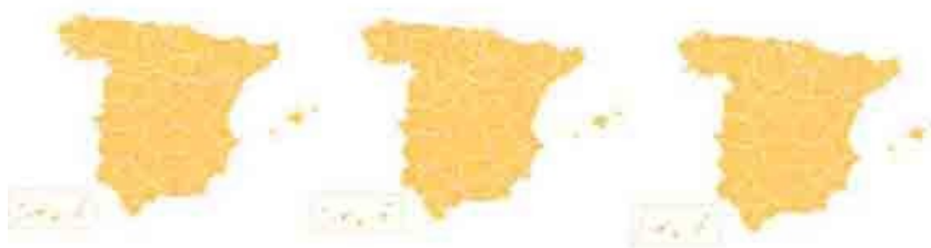
Ilustración 1 Huella ecológica española. Actualmente la huella ecológica española es tres veces la superficie de España.

discusión que la superficie que “utilizan” los países industrializados para sus necesidades es generalmente superior a la superficie existente dentro de sus límites territoriales, lo cual viene a significar que se están apropiando de la superficie de otros.